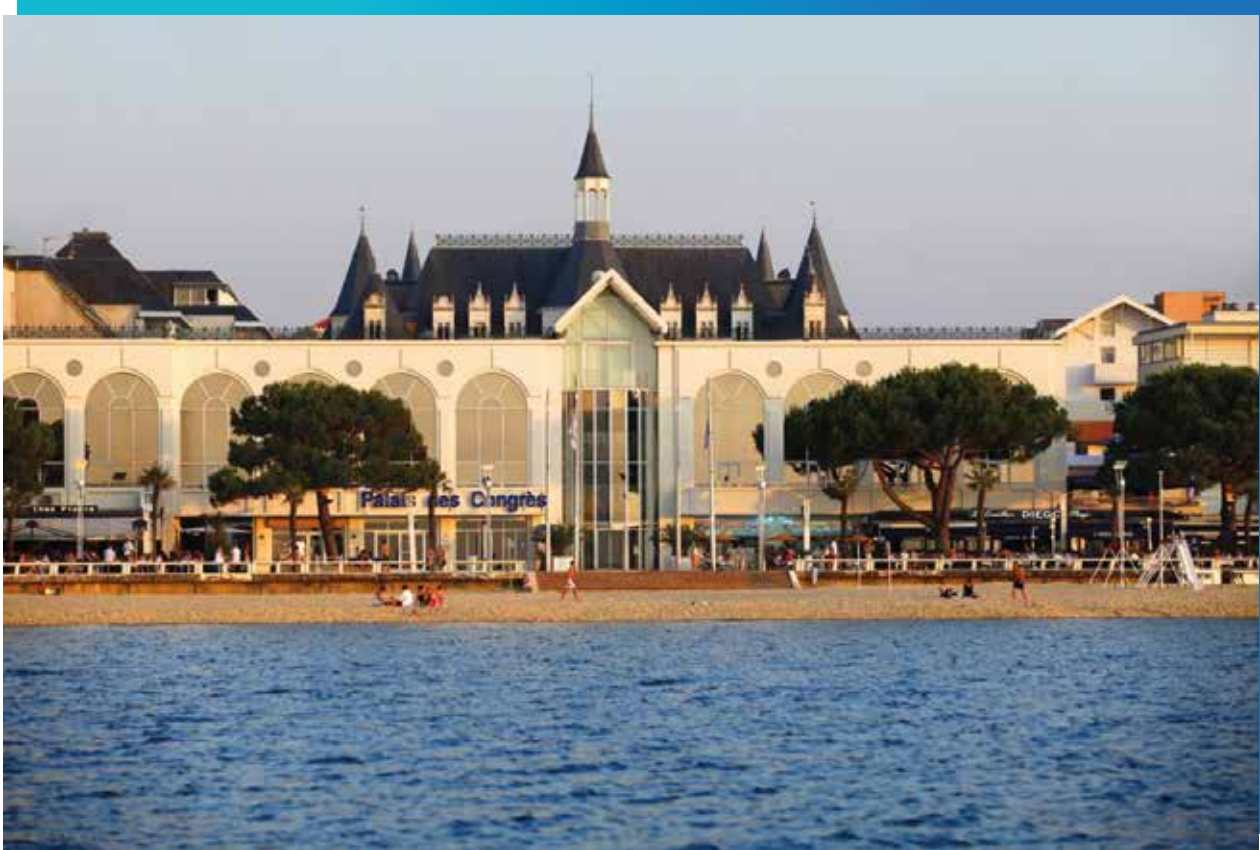
Palais des congrès d'Arcachon