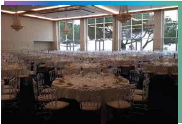
Salle des ambassadeurs

Professeur émérite de droit à l'université